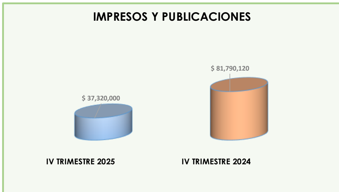
Gráfica N° 3

De acuerdo a la tabla N°5. Se establece que el rubro de “ impresos y publicaciones ” comparando el cuarto trimestre de las vigencias 2025 con la vigencia 2024, tuvo una disminución de Cuarenta y cuatro millones cuatrocientos setenta mil Pesos M/cte. ($44.470.120), correspondiente al 54.37%.