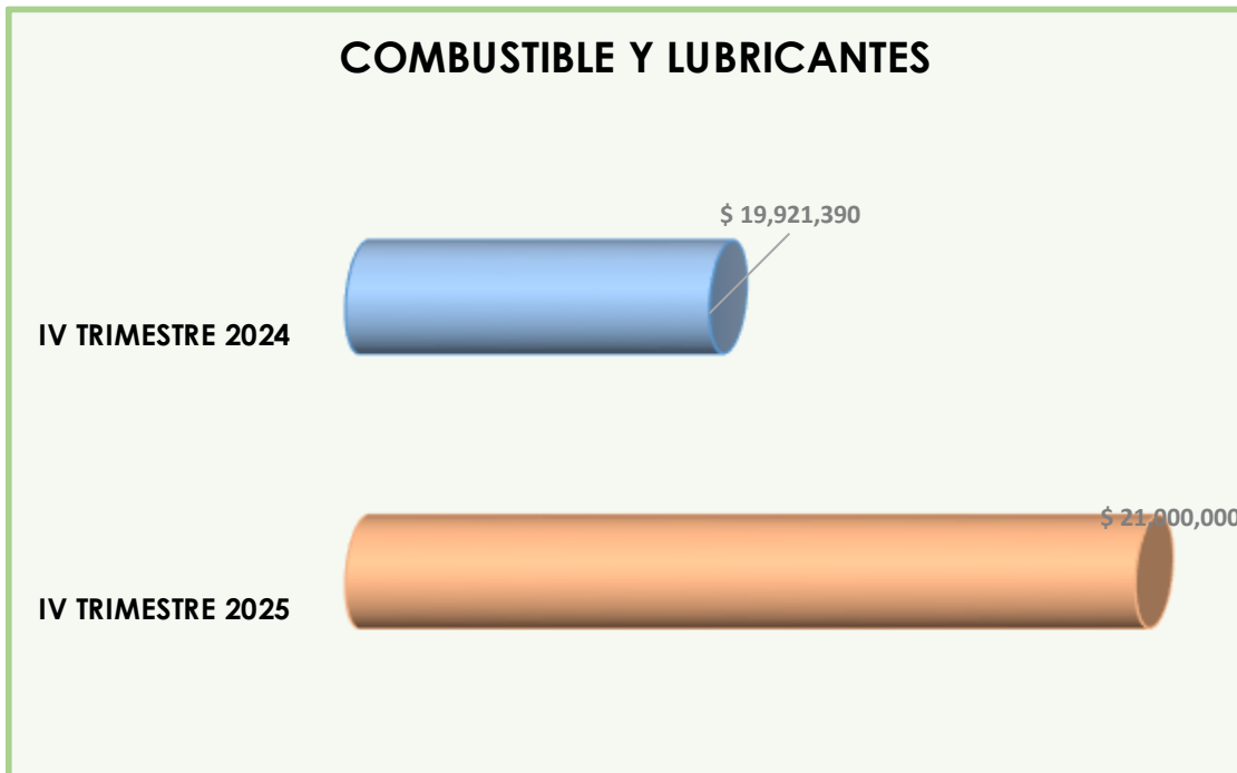
Gráfico N° 7

El gráfico 7. Muestra el comportamiento del combustible y lubricantes comparando el