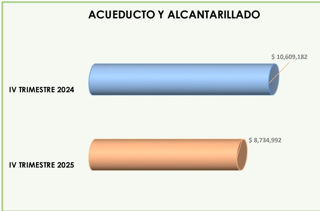
Gráfico N° 6

"Ambiente seguro. Responsabilidad de todos"