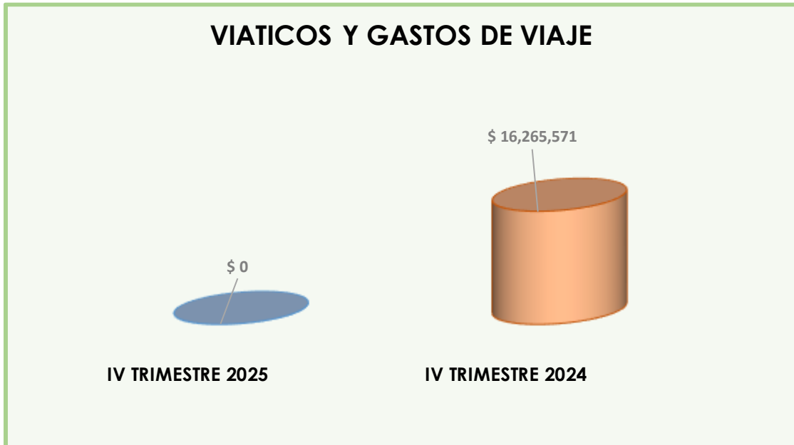
Gráfica N° 4

"Ambiente seguro. Responsabilidad de todos"